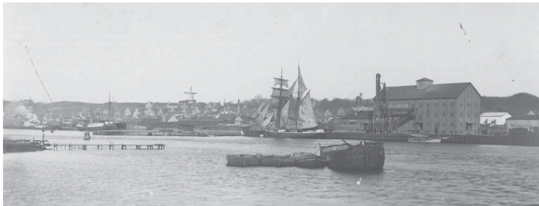
Østre Kaj år 1901.