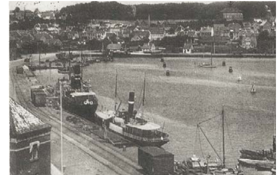
Dampskibe ved Jessens Mole.

For at leve op til målet om at det oprindelige skibsværftsmiljø fortsat skal kunne forstås og opleves bør en udvikling på Frederikssø tage udgangspunkt i bevaring af træskibsværftet i sin nuværende form og størst mulig genanvendelse af stålskibsværftets bygningsmasse på Frederikssøs vestside.