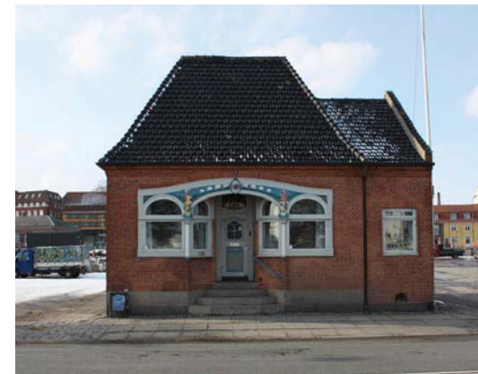
Gl. havnekontor på Jessens Mole, bevaringsværdi 3.