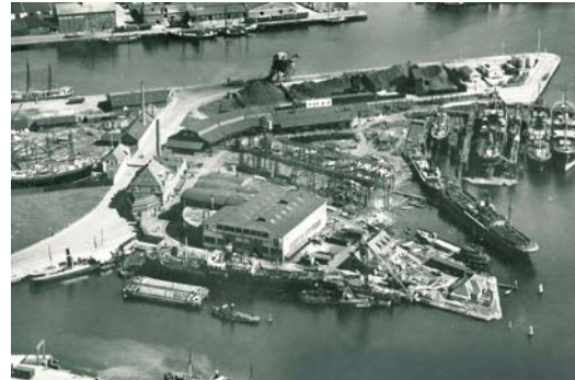
Værftshavnen på Frederikssø.

De behov for ændringer af Havnepladsen, som kan opstå ved en intensiveret færgedrift bør gennemføres under hensyntagen til områdets sårbarhed, herunder fastholdelsen af det åbne præg og bevaringen af kulturhistoriske spor på terræn i form af jernbanespor og granitbelægninger. Hensynet til de kulturhistoriske spor skal imidlertid afvejes i forhold til funktionalitet og tilgængelighed.