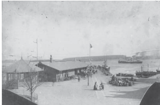
Havnepladsen ca. 1900.