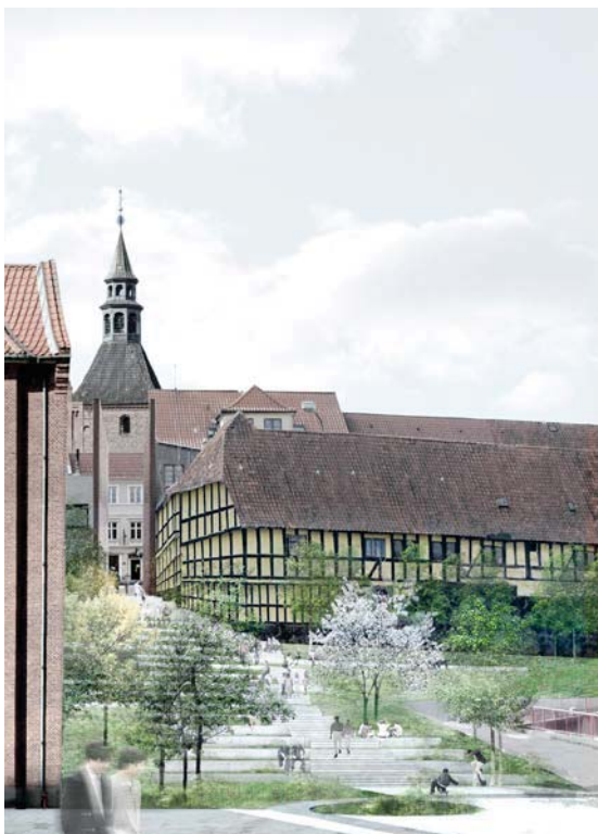
Visualisering af trappen fra Møllergade og gågaden til Toldbodvej og havnen.