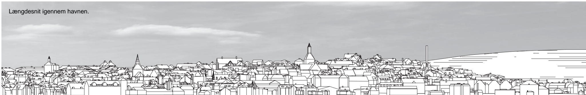
Længdesnit igennem havnen.