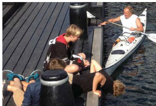
Nye muligheder for kajaker og småbåde.