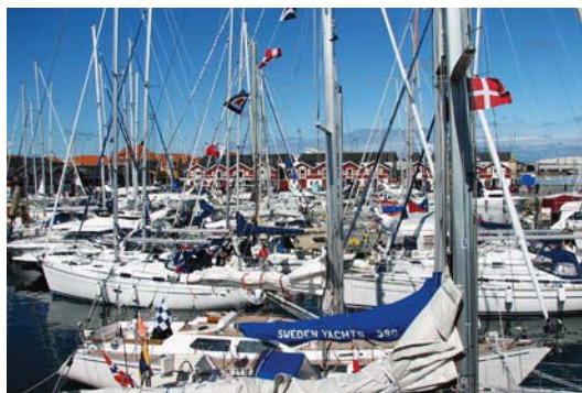
Udbygning af gæstehavn for lystsejlere.