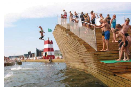
Havnebad (Islandsbrygge, København)

være relevant at etablere en pusleplads: et mindre skibsværftområde med bedding, hvor interesserede, frivillige og fagfolk kan mødes om vedligehold af gamle skibe og præsentere maritime håndværk. Frederiksøes vestkaj eller området op mod Ring Andersens Værft vil være de mest oplagte områder for disse aktiviteter. Endvidere kan den store byggebedding på Frederiksøen inddrages, f.eks. til et projekt for (gen)opbygning af et større træskib.